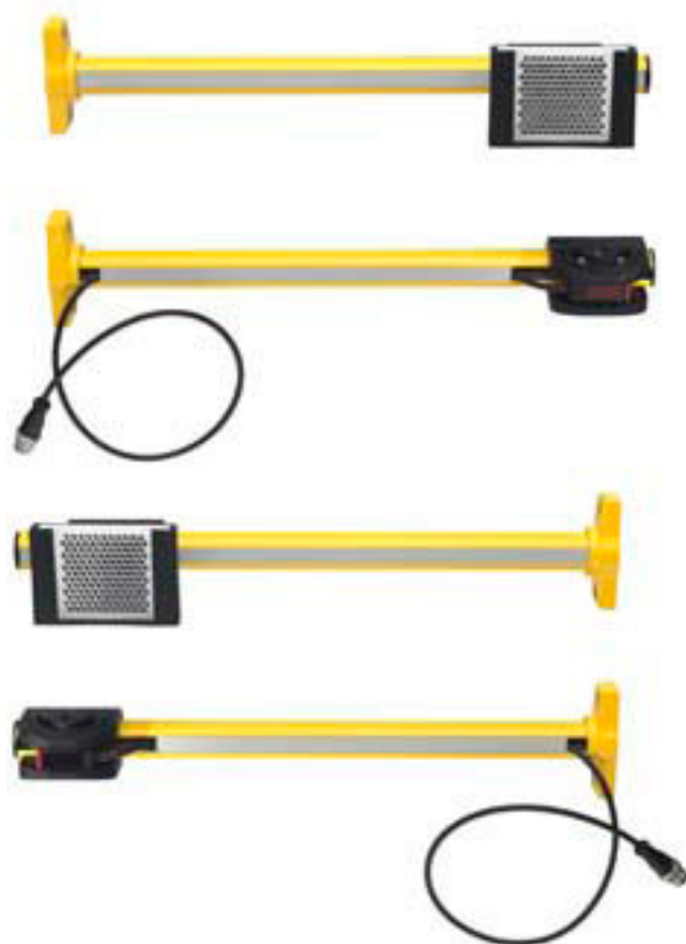
Figure pouvant varier