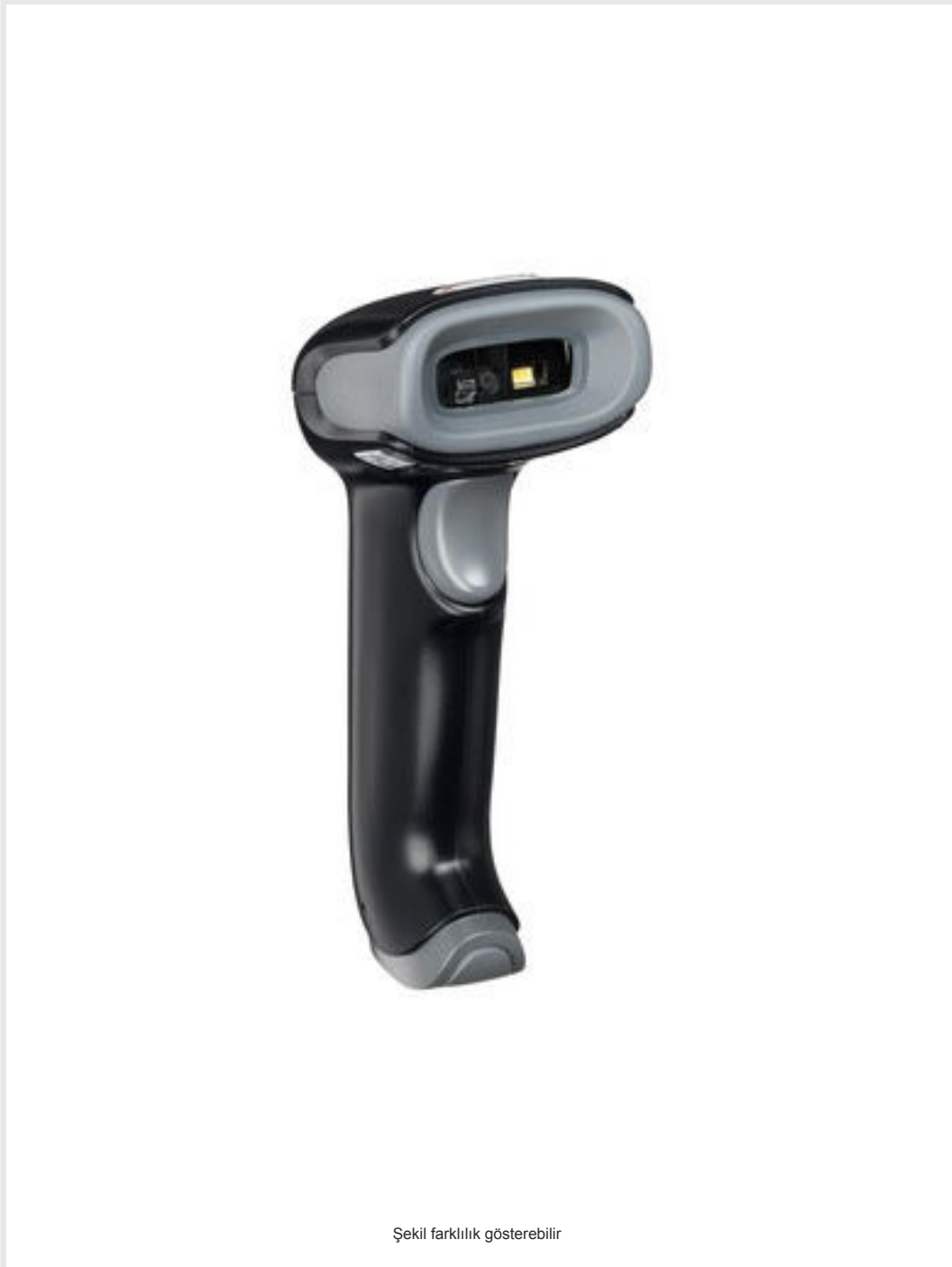
Şekil farklılık gösterebilir