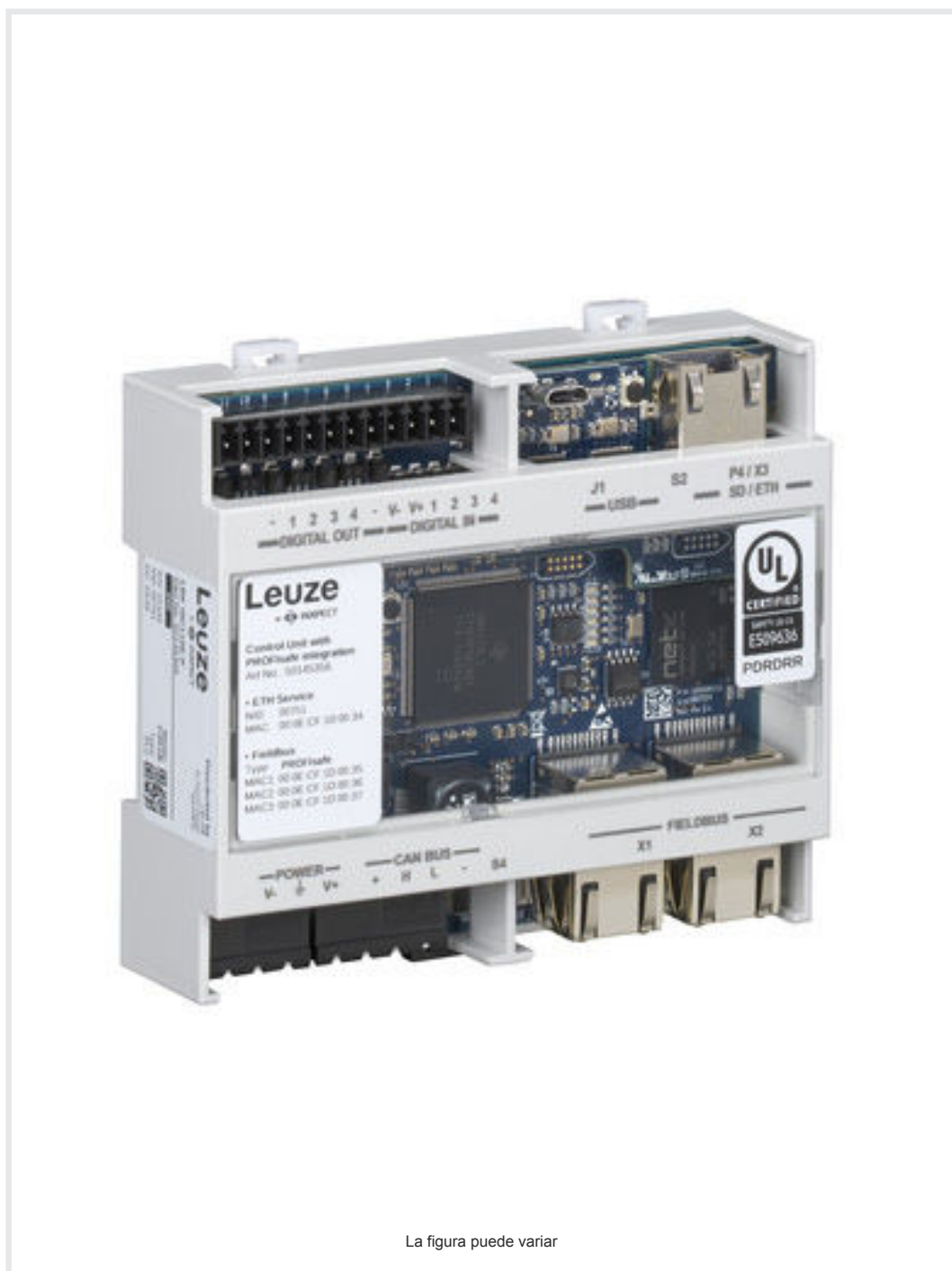
La figura puede variar