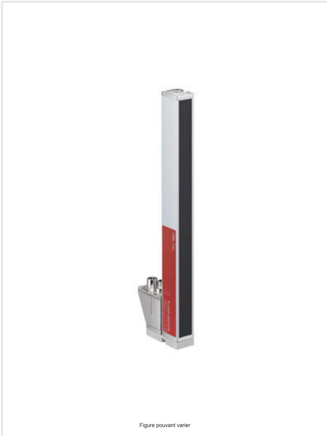
Figure pouvant varier