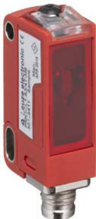
La figura puede variar