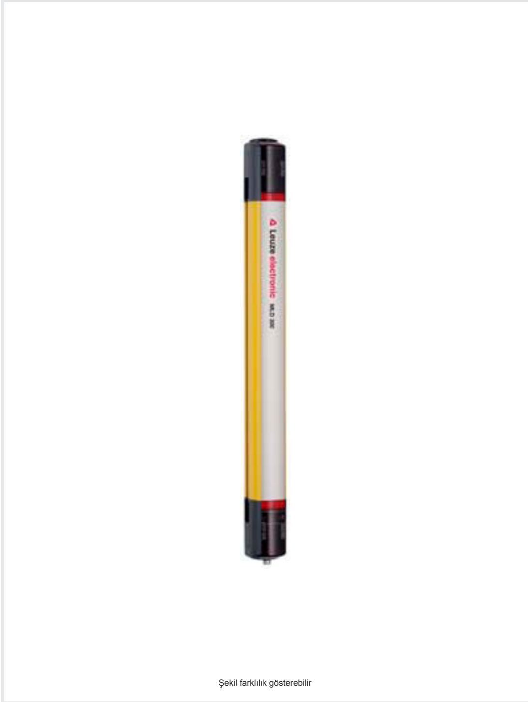
Şekil farklılık gösterebilir