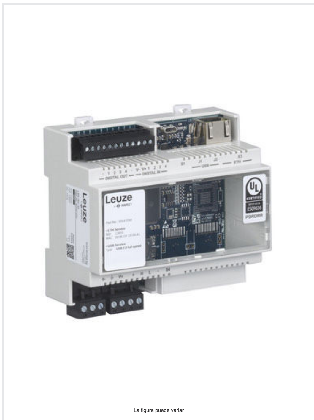
La figura puede variar