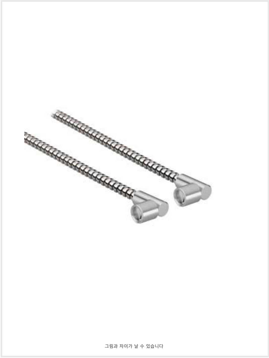
그림과 차이가 날 수 있습니다