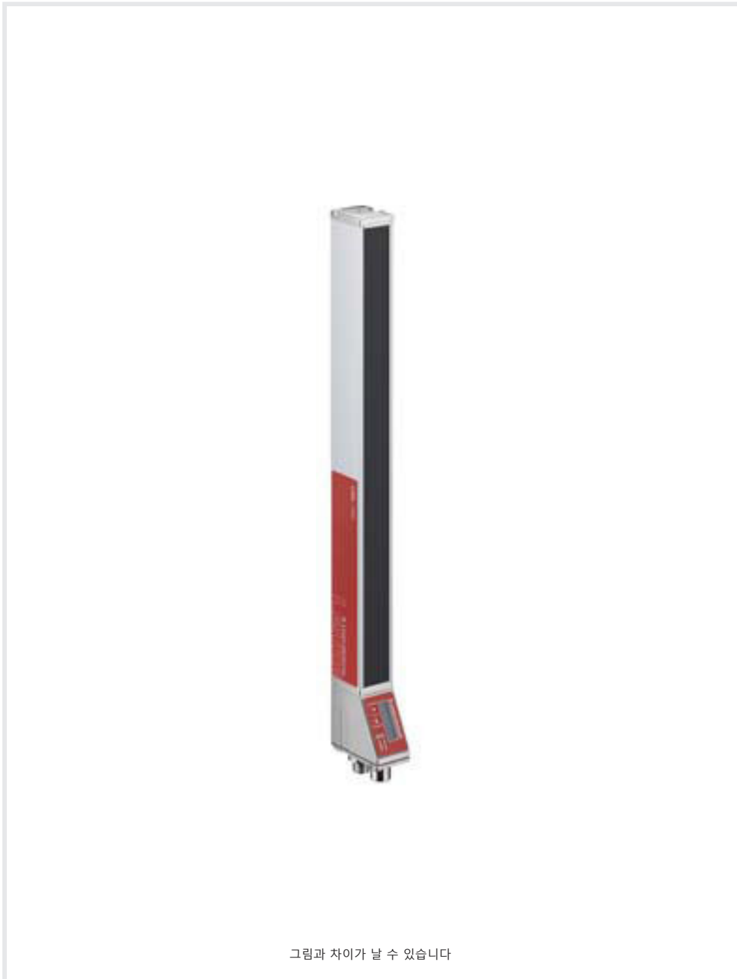
그림과 차이가 날 수 있습니다