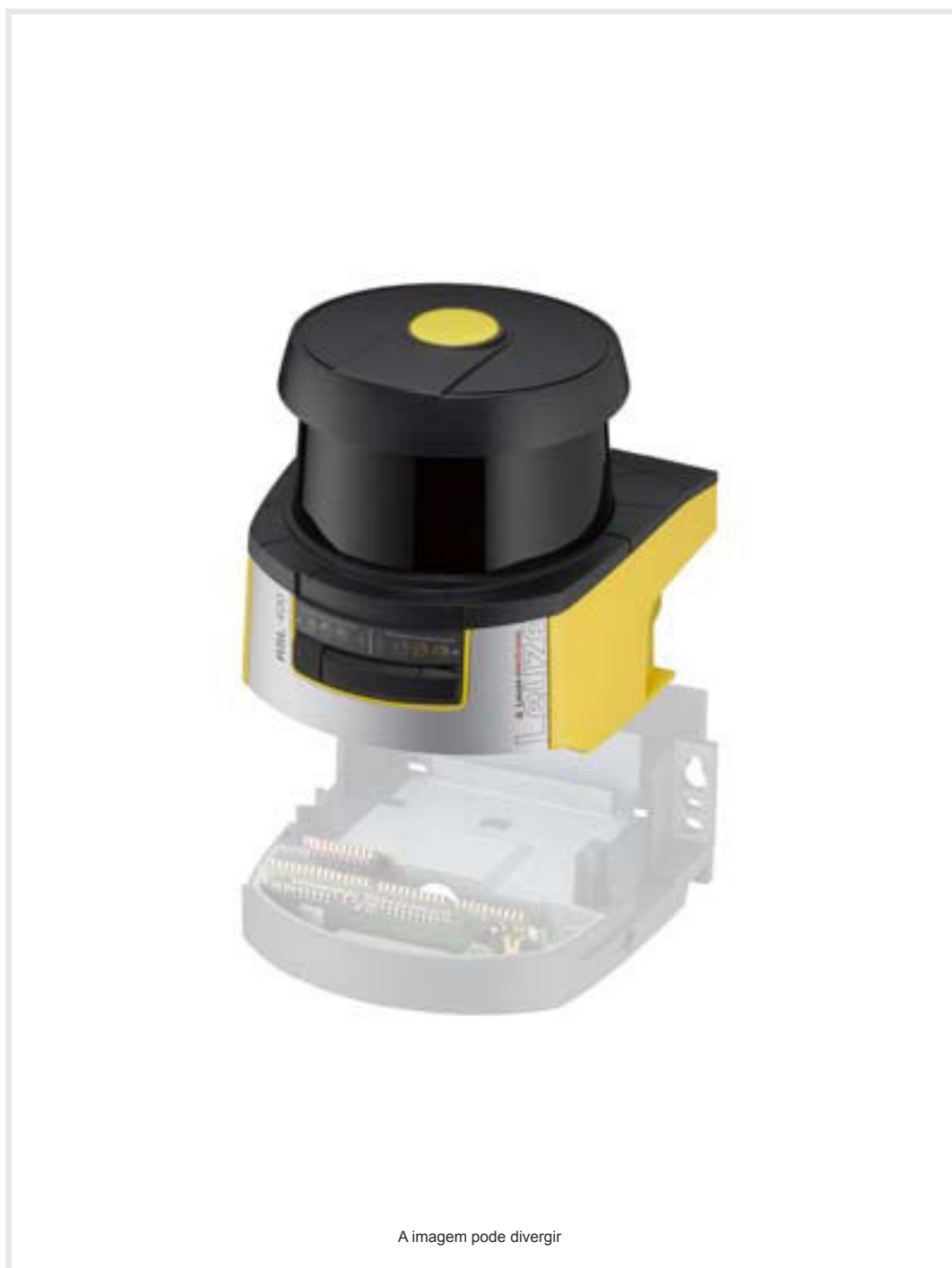
A imagem pode divergir