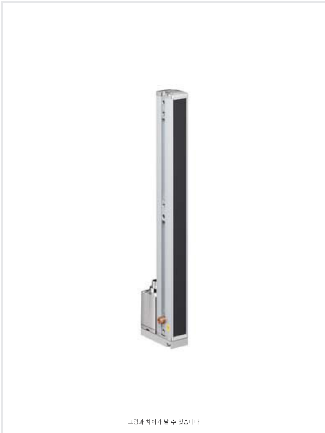
그림과 차이가 날 수 있습니다