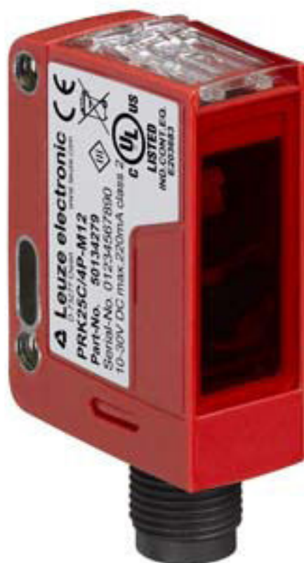
Afbeelding kan afwijken