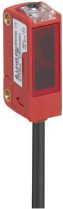
Şekil farklılık gösterebilir