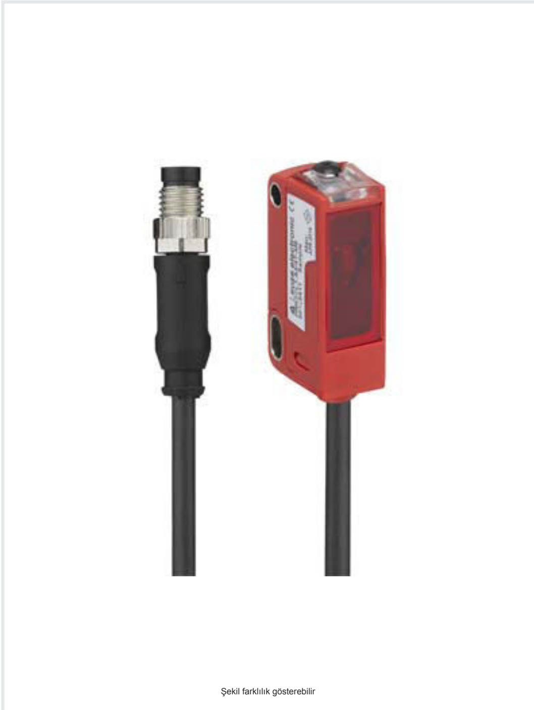
Şekil farklılık gösterebilir