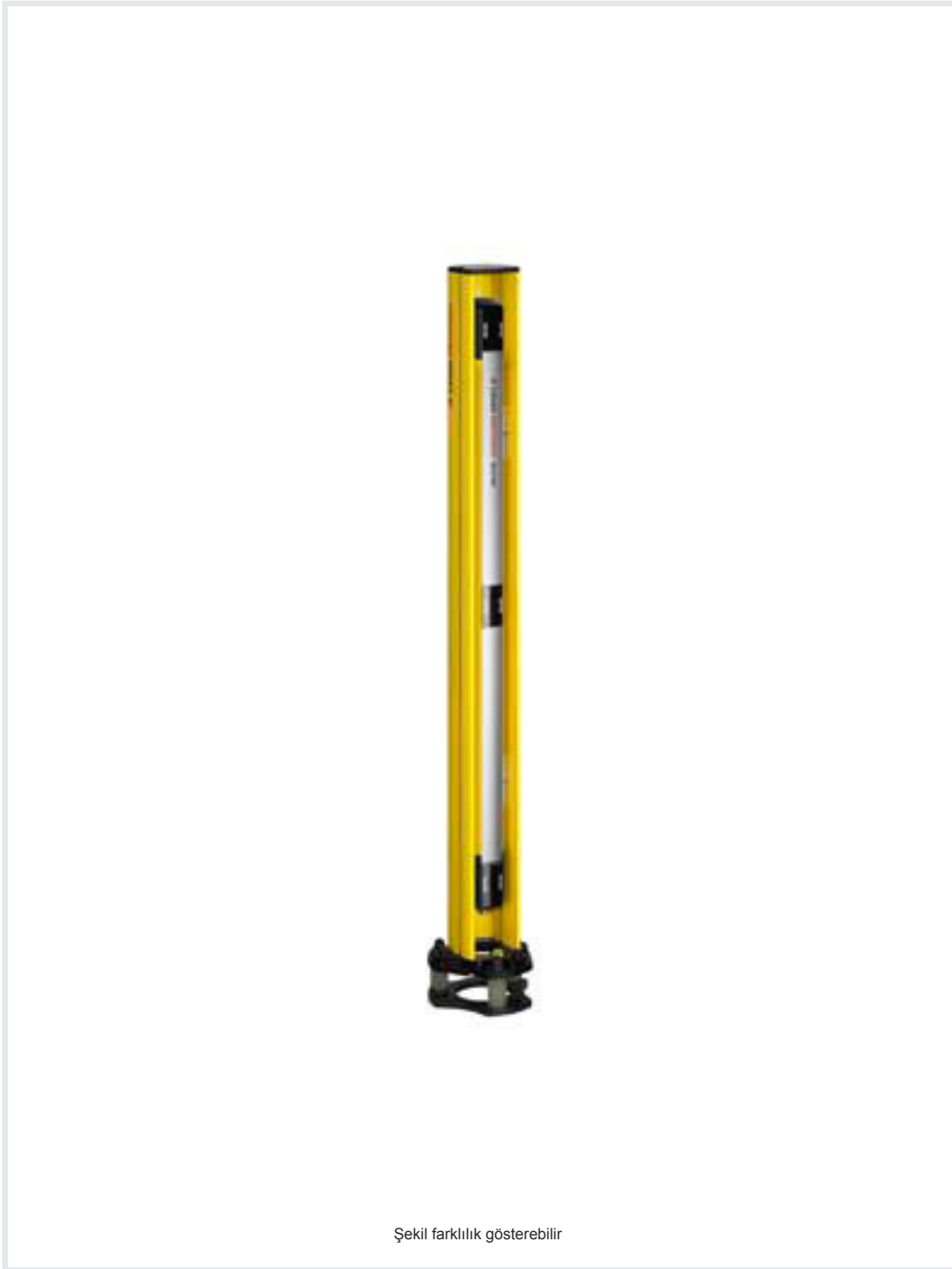
Şekil farklılık gösterebilir