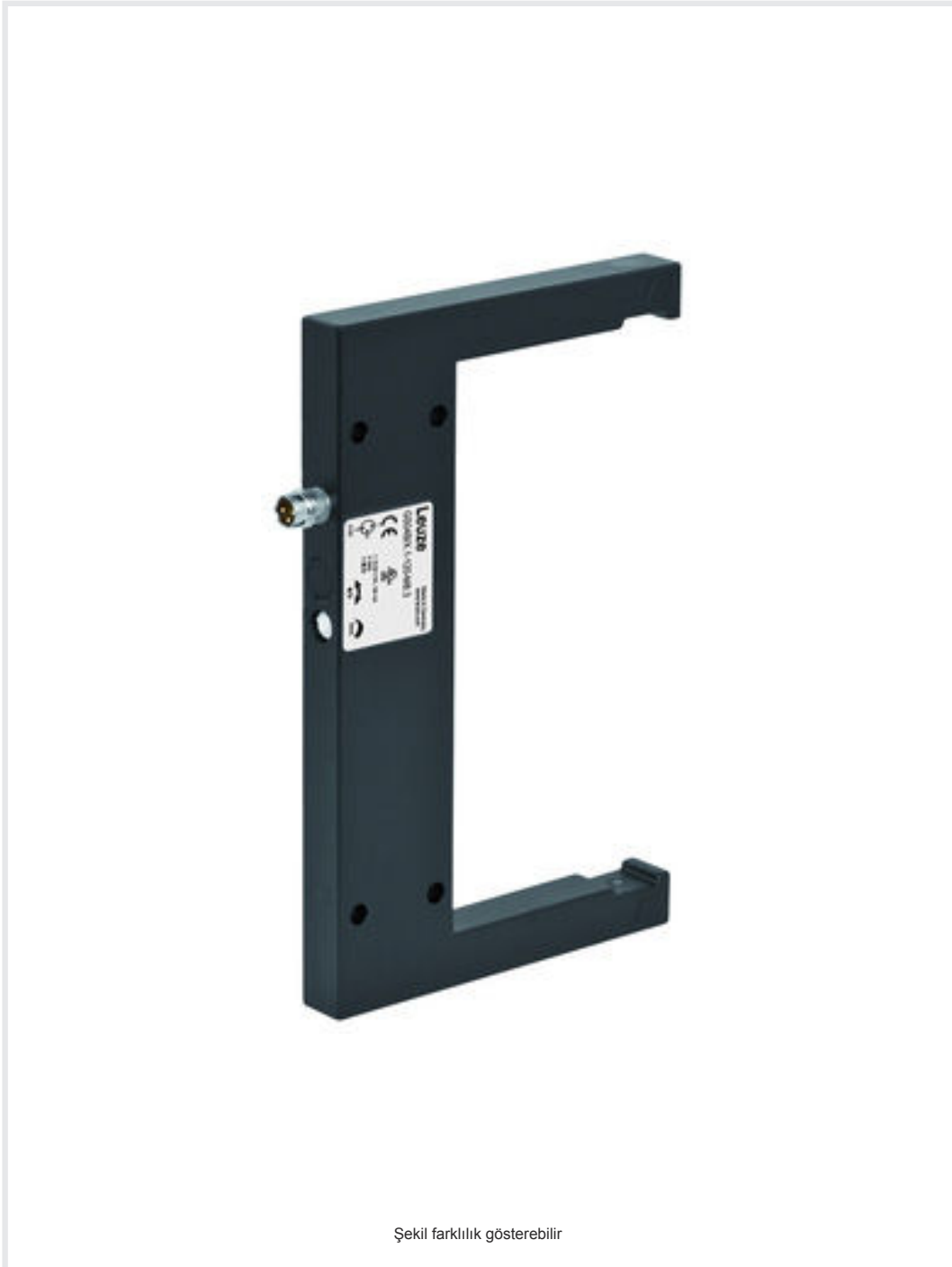
Şekil farklılık gösterebilir