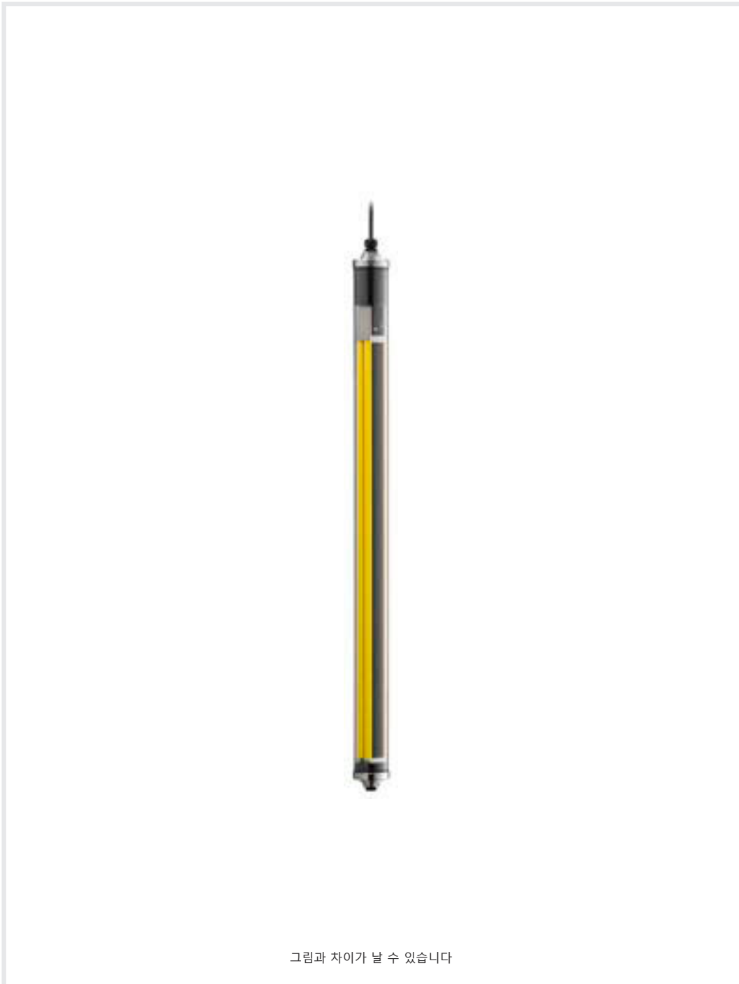
그림과 차이가 날 수 있습니다