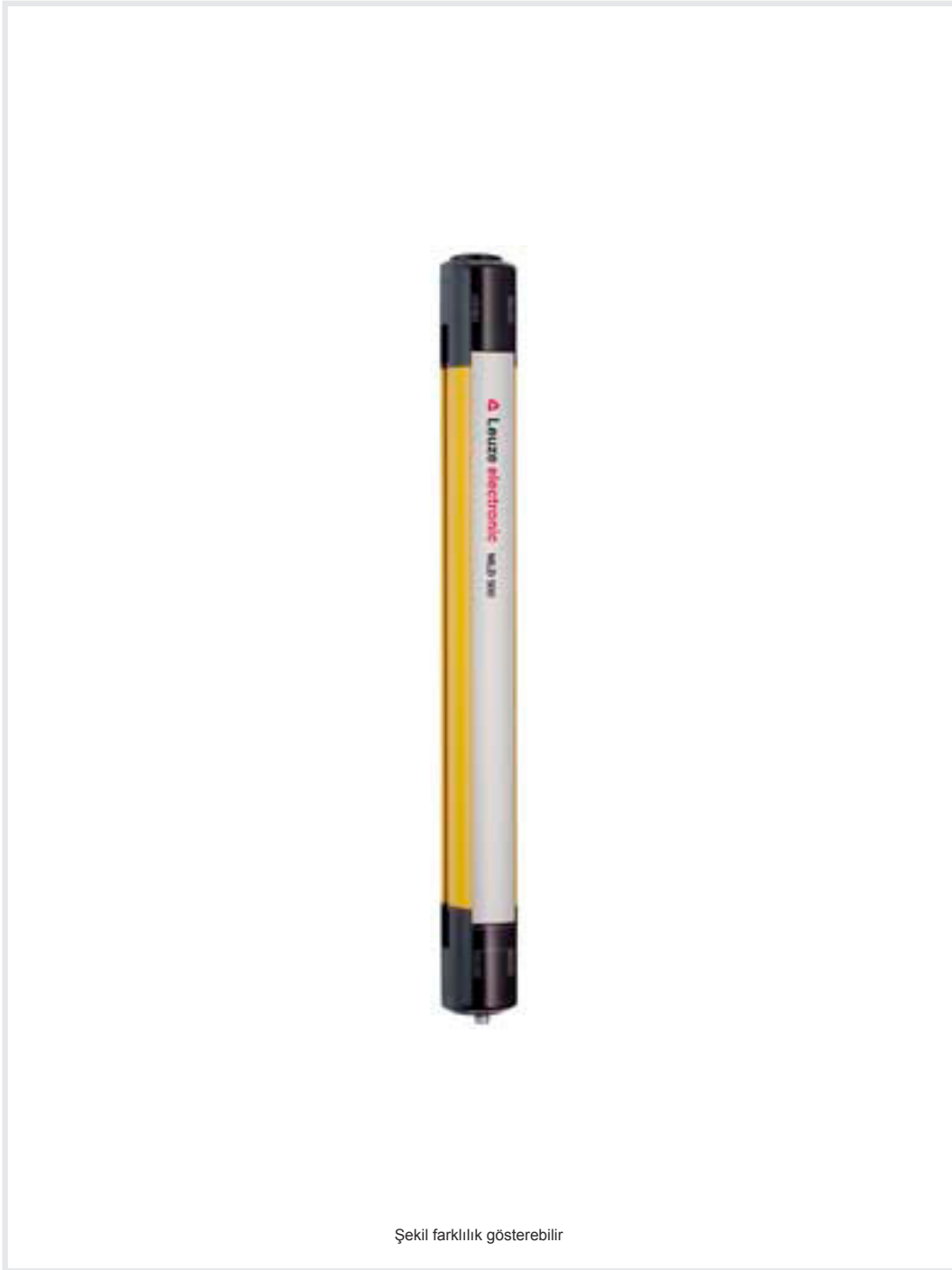
Şekil farklılık gösterebilir