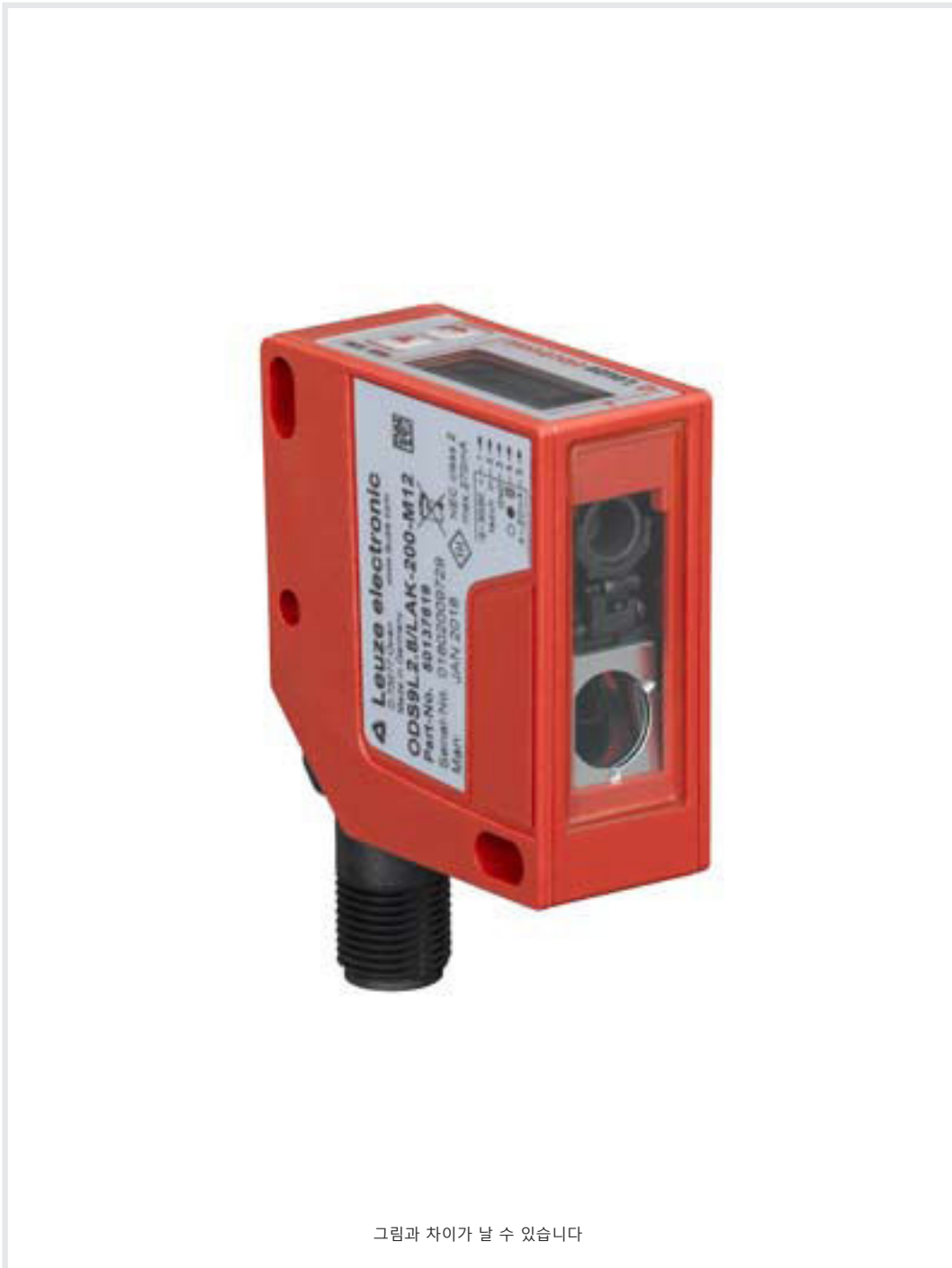
그림과 차이가 날 수 있습니다