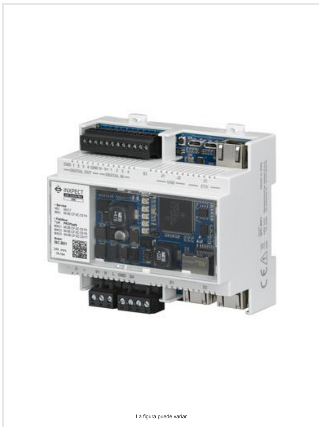
La figura puede variar