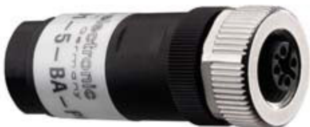
Figure pouvant varier