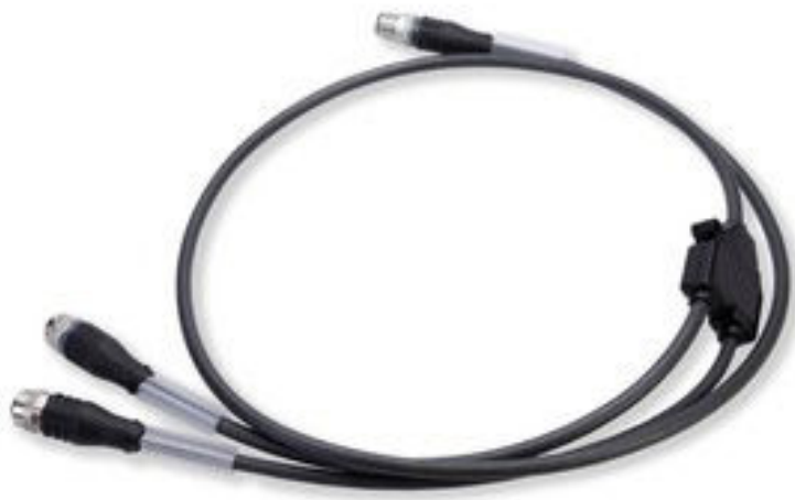
Figure pouvant varier