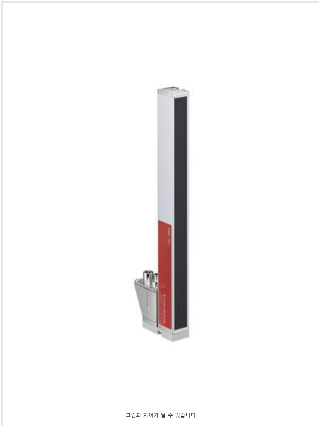
그림과 차이가 날 수 있습니다