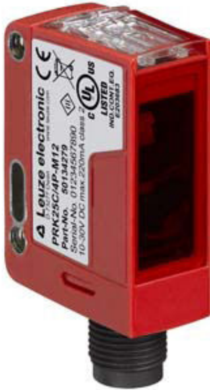
Şekil farklılık gösterebilir