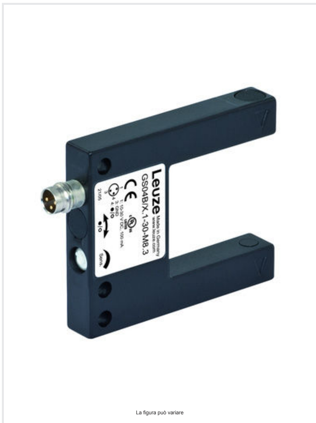
La figura può variare