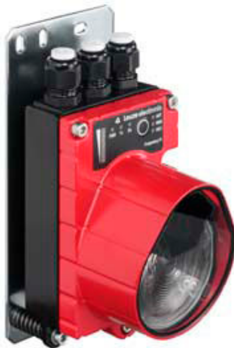
Figure pouvant varier