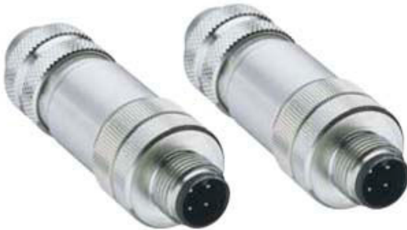
Figure pouvant varier