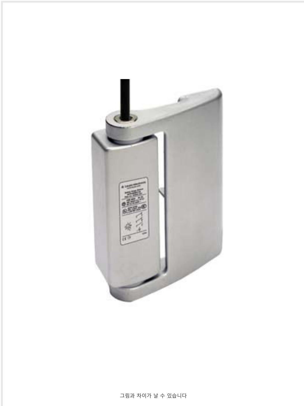
그림과 차이가 날 수 있습니다