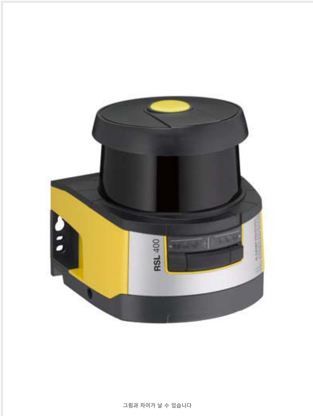
그림과 차이가 날 수 있습니다