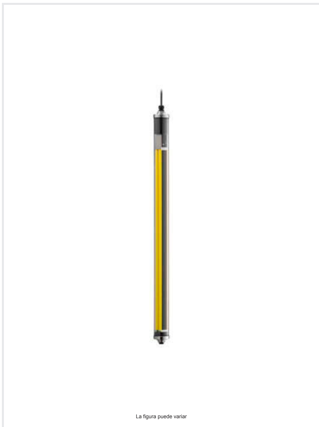
La figura puede variar