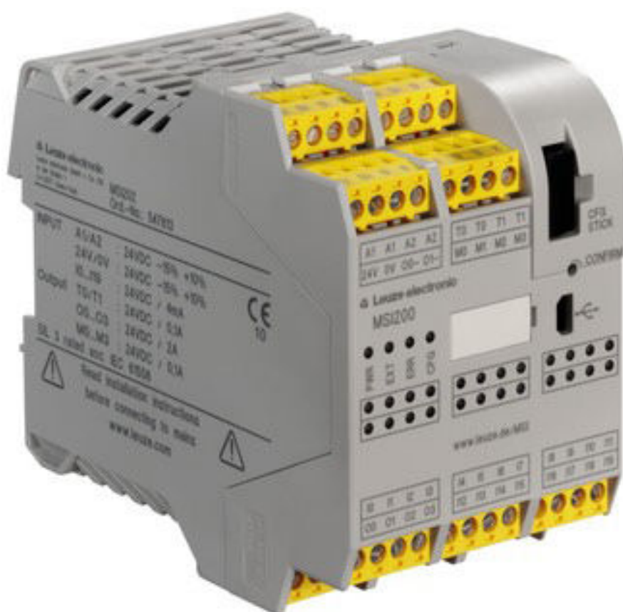
写真と異なる場合があります