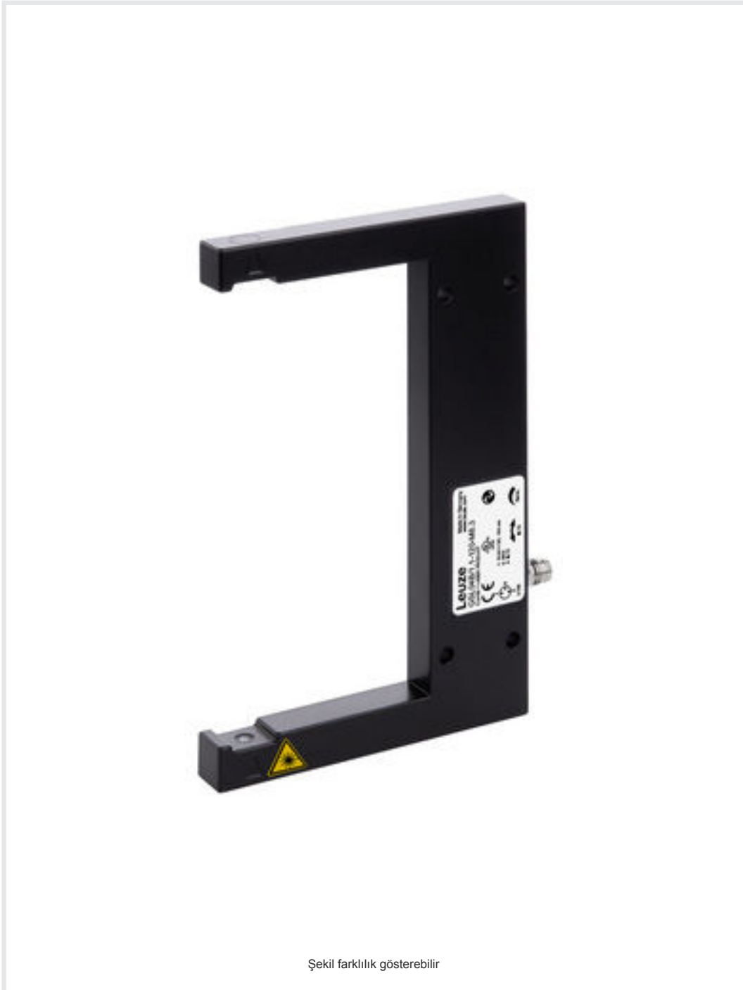
Şekil farklılık gösterebilir