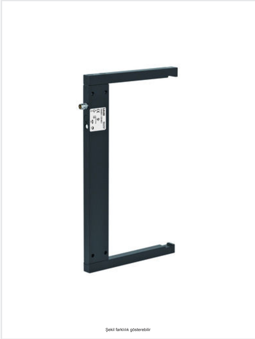
Şekil farklılık gösterebilir