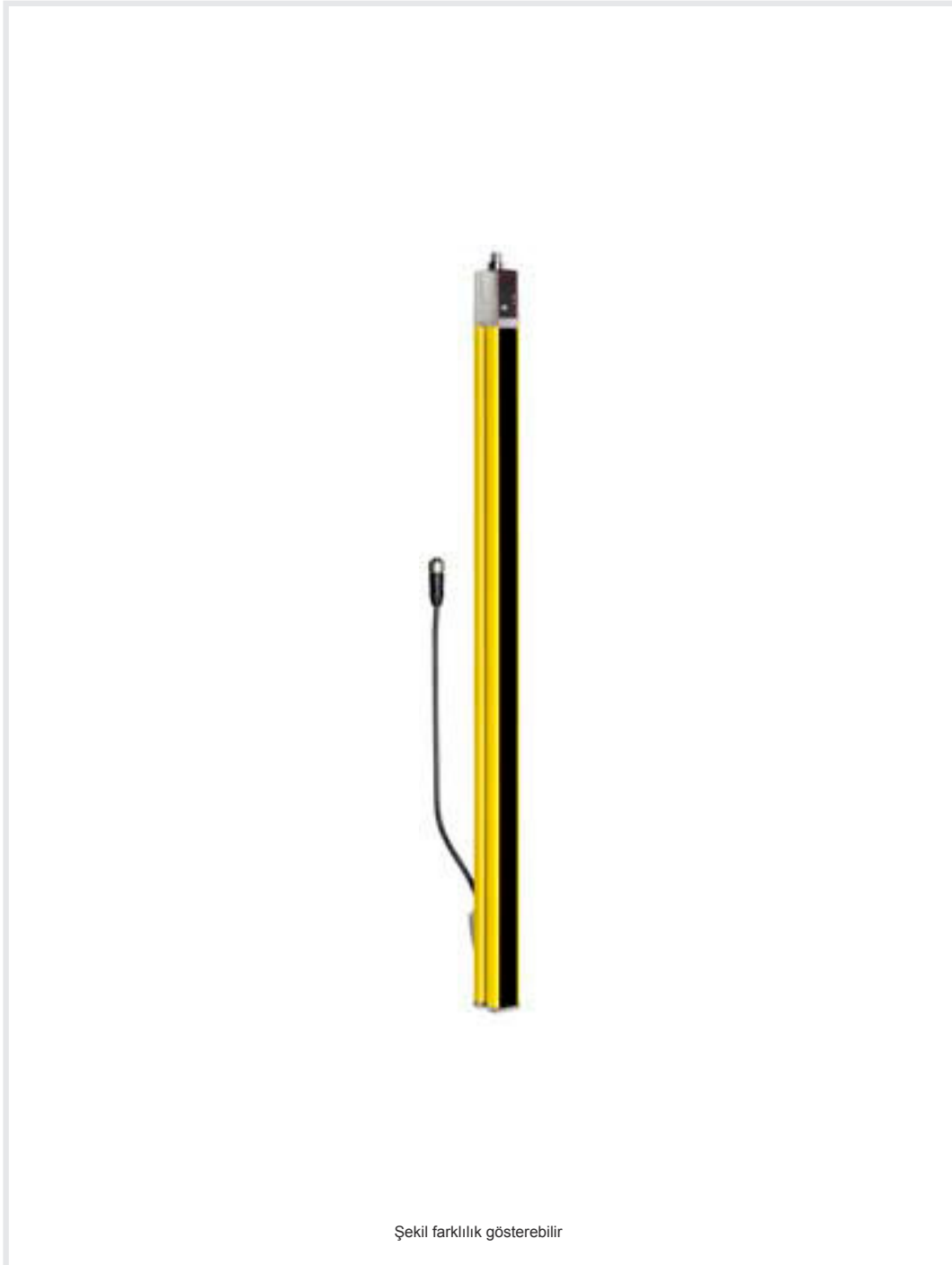
Şekil farklılık gösterebilir